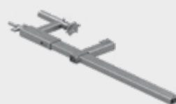
Suport de strângere L800 EPS-UUN800-V2 8,5 kg