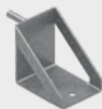
Suport pentru platformă de lucru EPS-UPR 1,8 kg