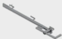
Stâlp cu suport de strângere EPS-UUS 7,2 kg