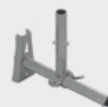
Suport de fațadă EPS-USP 3,9 kg