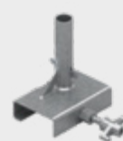
Talpă prindere de grindă EPS-UDZ-V2 3,4 kg