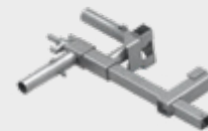
Suport pentru scară EPS-UUN-V4 7 kg