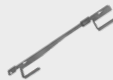
Suport dublu de perete EPS-US2 1,7 kg