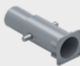
Suport permanent vertical EPS-UZH-v2 0,2 kg