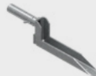
Suport de fixare EPS-UWB 2,4 kg